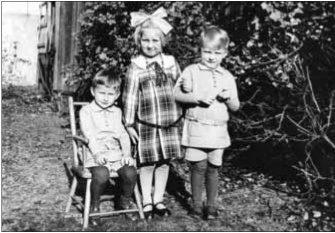
1934 Warnemünde

Ergänzt wird die Auswahl durch bewahrte historische Einzelstück und Puppenkleider aus dem eigenen Museumsbestand. Gezeigt wird die Ausstellung bis 28. Februar 2016.