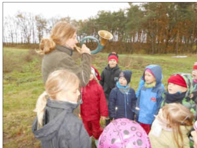
Fasziniert lauschten die Kinder den Klängen des Jagdhorns.

Als kleine Erinnerung an diesen Tag hatten die beiden Frauen kleine Holztiere im Wald „verloren“, die die Kinder auf ihrer Spurensuche finden und mit nach Hause nehmen konnten.