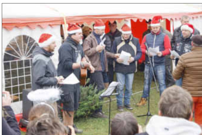
Mit kleinen Showeinlagen begeisterten die Kremminer Männer.