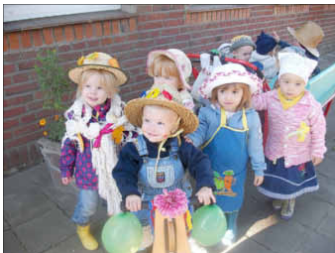
Auf geht's zum Erntenumzug.

Los ging es mit einem eigenen Erntefest, auf das sich die Mädchen und Jungen lange vorbereitet hatten.