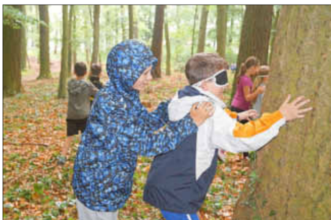
Sich voll und ganz auf seinen Partner verlassen, ihm vertrauen und sich trotzdem voll auf seine Sinne zu konzentrieren, waren Ziel dieser Station, die alle Kinder begeisterte.

Bundesministerium für Familie, Senioren, Frauen und Jugend