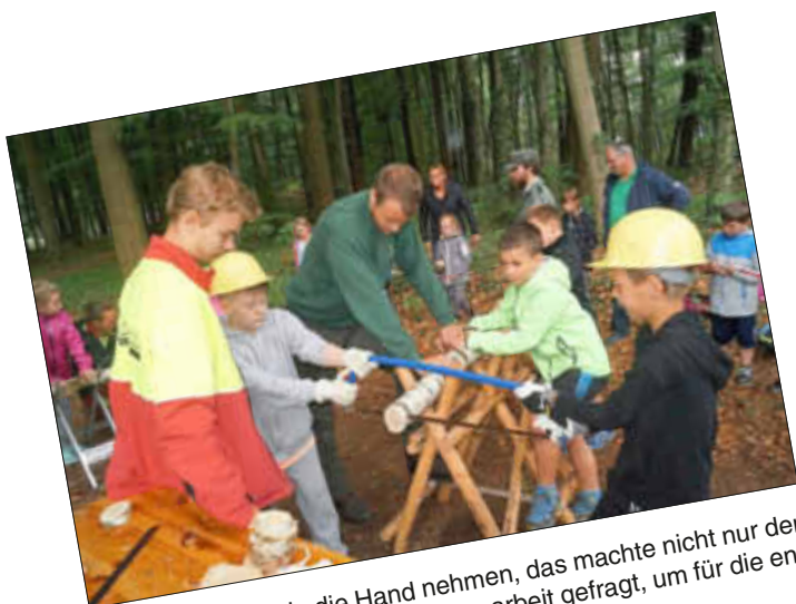
Einmal die Säge in die Hand nehmen, das machte nicht nur den Jungen Spaß. Auch hier war Teamarbeit gefragt, um für die entsprechende Sicherheit zu sorgen.

Wald bewegt - Sport verbindet“ lautet der Titel einer Kooperationsvereinbarung des Landessportbundes Mecklenburg-Vorpommern e. V. mit dem Ministerium für Landwirtschaft und Umwelt Mecklenburg-Vorpommern, die beide Seiten am 16. April 2018 unterzeichnet haben. In diesem Zusammenhang fanden vor wenigen Tagen im Grabower Schützenpark die 1. WaldSportSpiele statt, zu denen über 350 Kinder aus den Grundschulen des Amtes Grabow eingeladen waren.