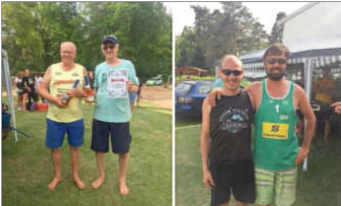
„die Alten“ (links) und „Die Daddys der 5 Teufel“ (rechts)