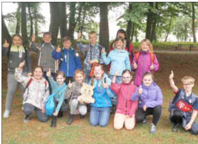
Sieger der diesjährigen Waldolympiade in Grabow wurde die 4. Klasse der Grundschule Eldena.