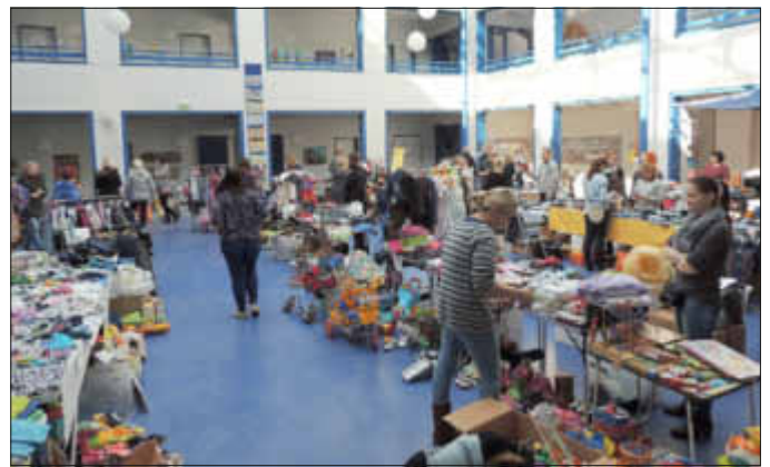
Reges Treiben in der Aula der Grundschule