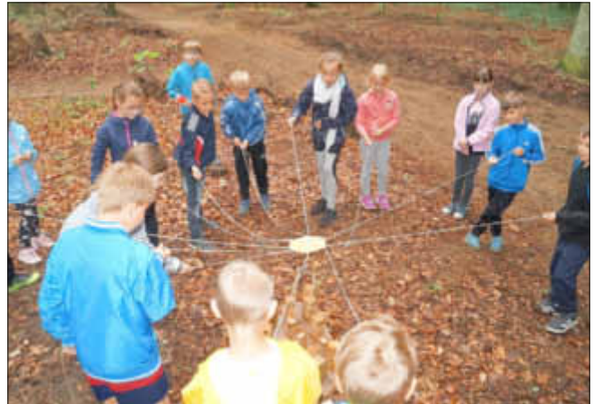
Echtes Teamwork war hier gefragt, denn nur wer Hand in Hand zusammenarbeitete und miteinander redete, schaffte es die kleinen Holzklötzer zu einem Turm zu stapeln.