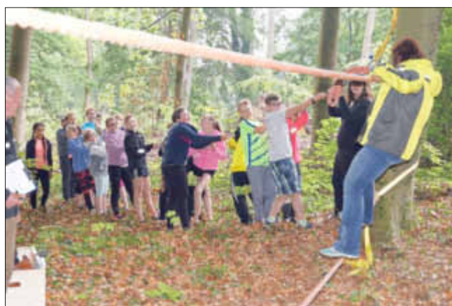
Alle ziehen an einem Strang - so das Motto an dieser Station, denn wenn die Klasse locker ließ, „stürzte“ der auf dem Seil kletternde ab. Doch die Mädchen waren hoch motiviert und ließen es soweit natürlich nicht kommen.