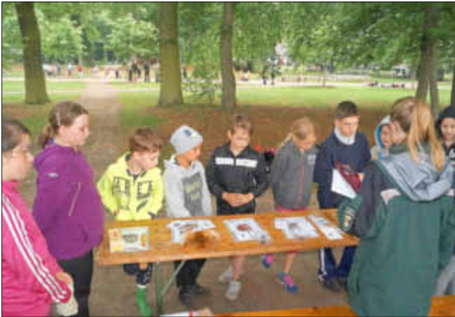
Den Wald und seine Bewohner zu kennen, heißt auch sie schützen zu können. Und was der eine nicht wusste, dabei konnte der andere helfen. So funktioniert gelebte Demokratie.