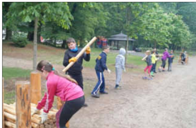
Auch beim Holzstapeln hatten nur die Gruppen eine Chance das Ziel in der vorgegebenen Zeit zu erreichen, die echten Teamgeist bewiesen: Die Stärken der einen zu nutzen, um kleine Schwächen anderer auszugleichen.