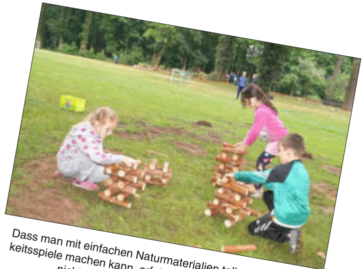
Dass man mit einfachen Naturmaterialien tolle Geschicklichkeitsspiele machen kann, erfuhren die Mädchen und Jungen nicht nur beim Turmbau aus Aststücken.