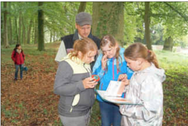
Im Rahmen der WaldSportSpiele absolvierten die Schülerinnen und Schüler die landesweit durchgeführte, alljährliche Waldolympiade. Hier war unter anderem auch das erlernte Wissen aus dem Unterricht gefragt.

Gefördert im Rahmen des Bundesprogramms Demokratie Leben!