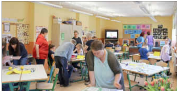
Alles war perfekt und liebevoll vorbereitet und an das leibliche Wohl wurde auch bestens gedacht. Bei den Angeboten bekommt man