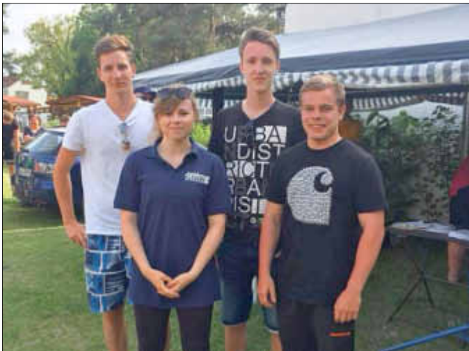
Die „Junge Union“

Beim Firmen-Cup gingen in diesem Jahr 9 Mannschaften an den Start - hier gewann die „Junge Union“ vor „SCHORISCH Magis“ und „B&S Landtechnik“.