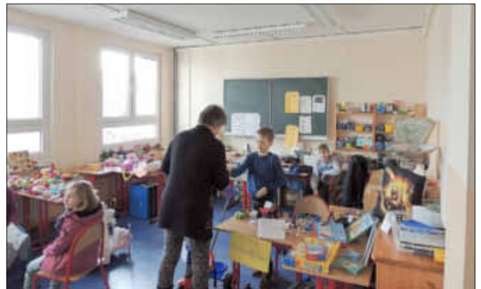
Durch den Verkauf von Spielzeug wurde fleißig das Taschengeld aufgebessert.